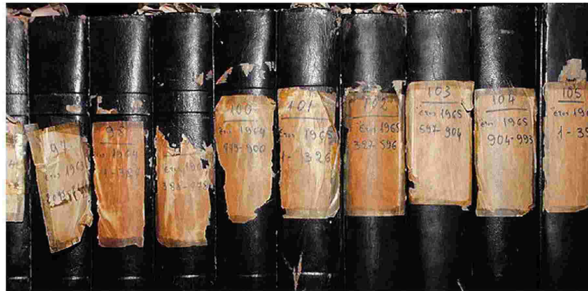
Χιλιάδες τόμοι θα ψηφιοποιηθούν και θα είναι στη διάθεση του κοινού.

Η ψηφιοποίηση του αρχείου του δημοτικού συμβουλίου προχωρά σε συνεργασία με το Διεθνές Πανεπιστήμιο Ελλάδας