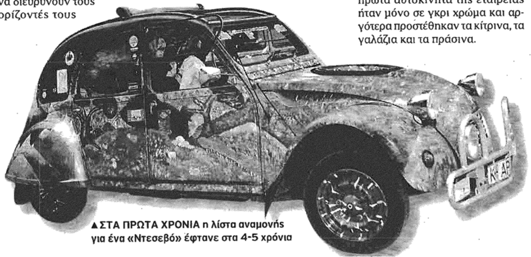
▲ ΣΤΑ ΠΡΩΤΑ ΧΡΟΝΙΑ η λίστα αναμονής για ένα «Ντεσεβό» έφτανε στα 4-5 χρόνια

Είναι χαρακτηριστικό πως τα πρώτα αυτοκίνητα της εταιρείας ήταν μόνο σε γκρι χρώμα και αργότερα προστέθηκαν τα κίτρινα, τα γαλάζια και τα πράσινα.